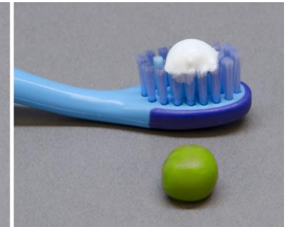
Para niños de 3 a 6 años de edad