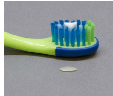
Para niños menores de 3 años